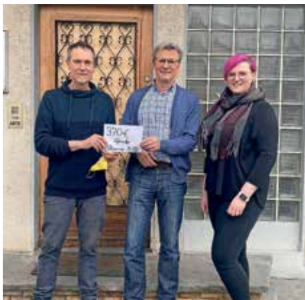
Spende für die Ukraine-Hilfe